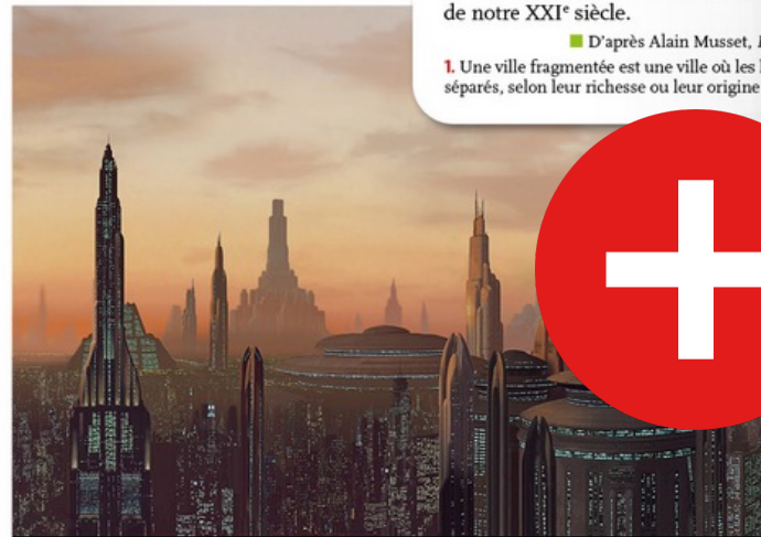
2 Coruscant [Star Wars] Star Wars, épisode I : La Menace fantôme , film de George Lucas, 1999.

Coruscant est à la fois un modèle et un contre-modèle. Les paysages urbains de cette planète entièrement recouverte par la ville sont une transposition des métropoles de la côte Atlantique. Mais les divisions qui sont visibles dans les quartiers de Coruscant sont aussi l'expression des divisions de l'espace qui caractérisent l'ensemble de notre XXI e siècle.